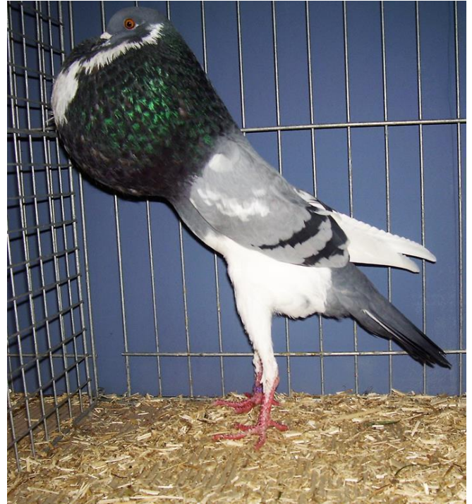
1,0 blau, HSS 2017 V97, J. Dankert