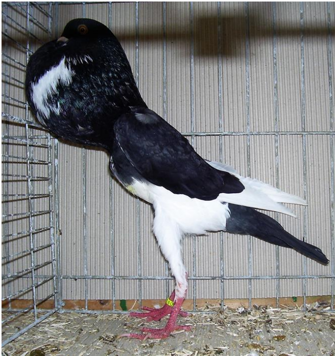
1,0 schwarz, HSS 2017 hv96, H. Schingen