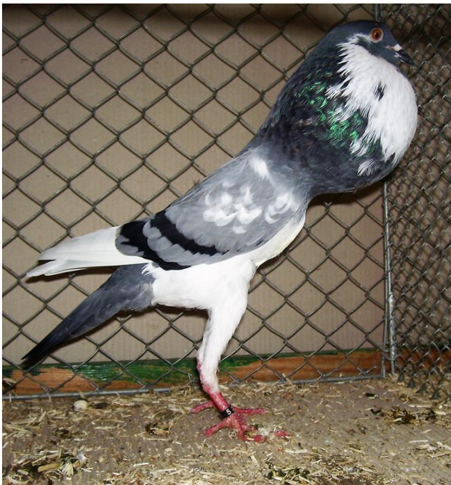
0,1 blau, HSS 2017, hv96, K. Hartmann