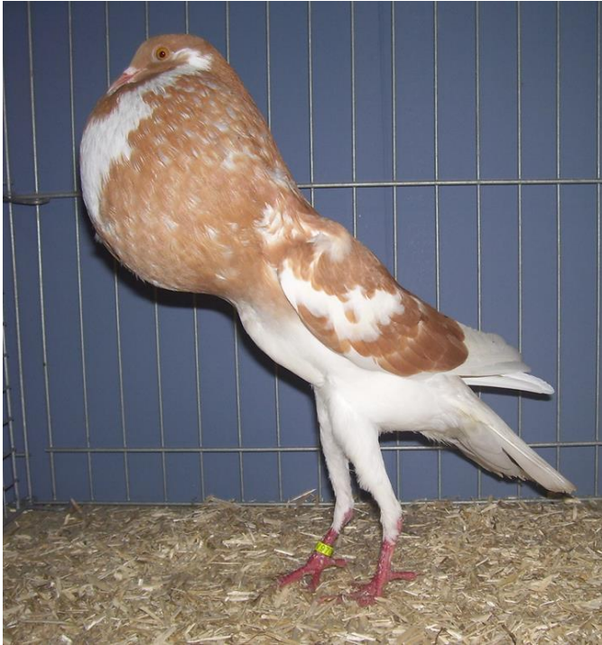
0,1 gelb, HSS 2017 V97, K. Hartmann