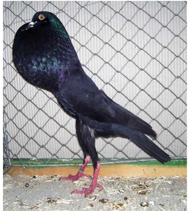
1,0 schwarz-einf., HSS 2017 hv96, H. Schingen