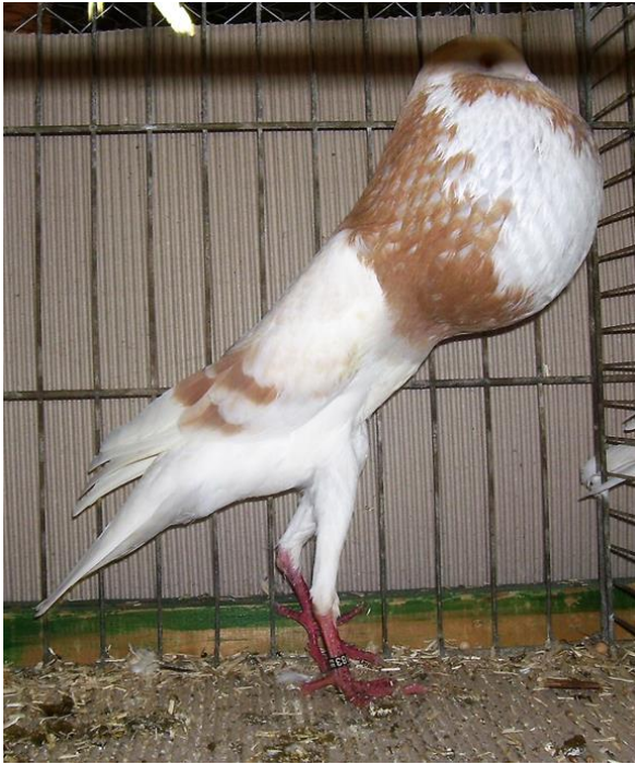
1,0 gelbfahl, HSS 2017 sg95, J. Menge