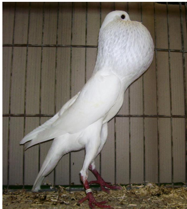
1,0 weiß, HSS 2017 sg95, Ch. Taubert